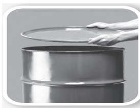
Feche bem tonéis e barris

Defenda sua família, seus vizinhos, sua comunidade. Não basta combater o mosquito. Precisamos eliminar seus criadouros e qualquer local ou recipiente que acumule água parada.