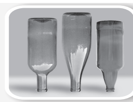
Esvazie e guarde garrafas sem uso de cabeça para baixo