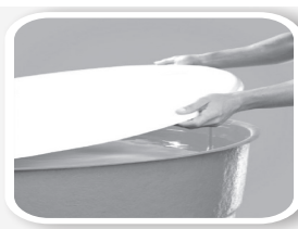
Tampe caixas d'água