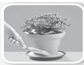
Coloque areia no pratinho dos vasos de plantas